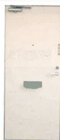
アイボリー (内部色)